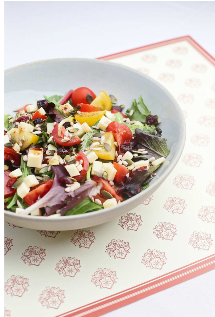
La salade estivale